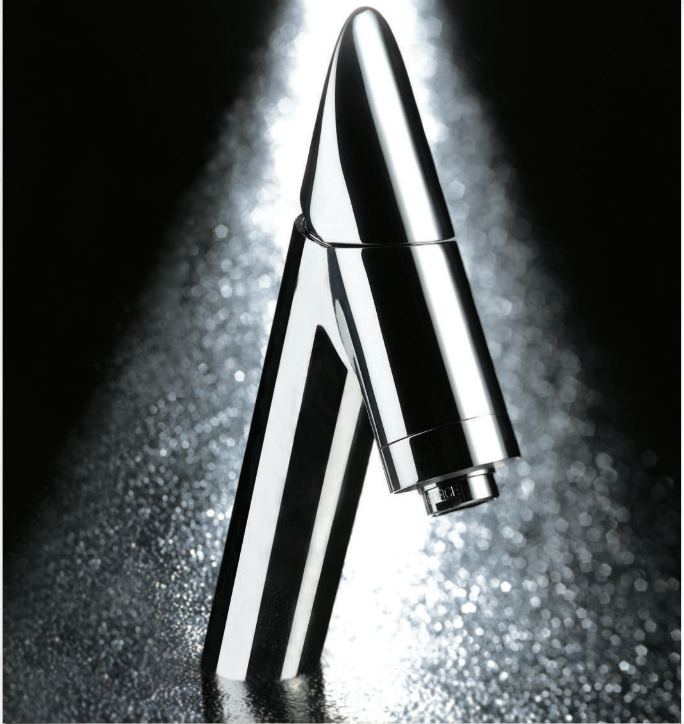
Design: Marco Poletti Miscelatore "One" / Mixer "One"