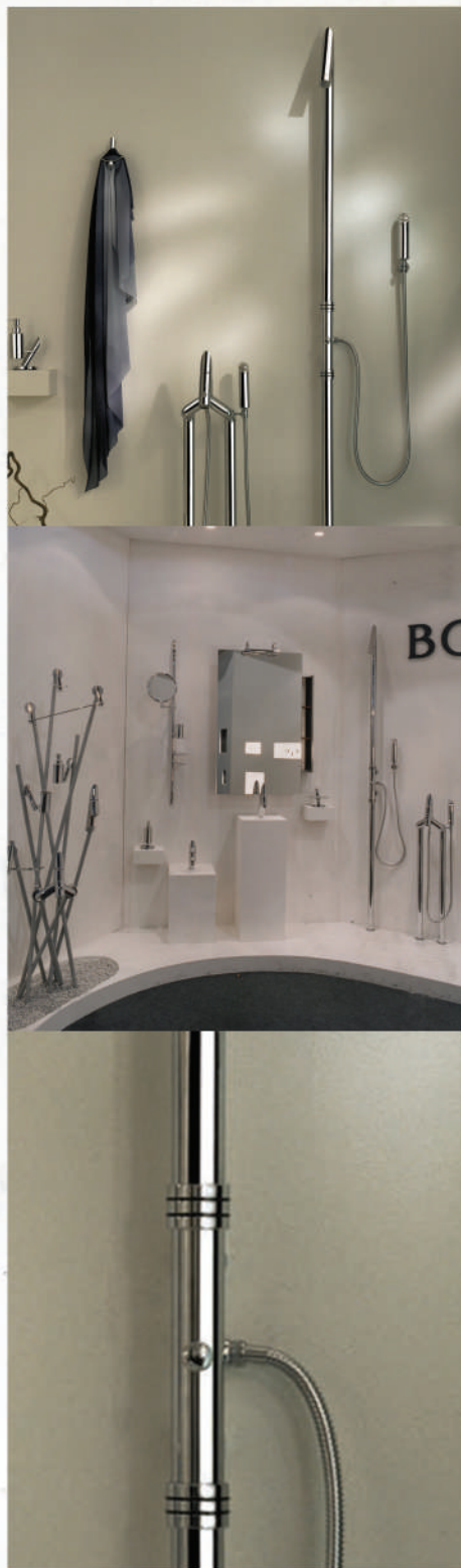
Design: Marco Poletti "One collection" miscelatore doccia / Shower mixer

Tra gli elementi della collezione "One" ne ricordiamo solo alcuni: lo specchio con cassettera in acciaio con mensole in legno Teck; la vasca a piantane esterne che riprende le vecchie rubinetterie, e infine, il nuovo miscelatore con il quale si può regolare con la maniglia superiore la temperatura dell'acqua e con quella inferiore la quantità di erogazione.